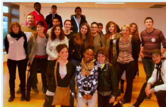
Un groupe de 20 volontaires, heureux de partir à l'étranger après la formation Auberge de Jeunesse Yves Robert, Paris – 10/10/2015

2 sessions de formations au départ de 2 jours ont été mises en place afin d'optimiser le départ de chacun des volontaires (18-20 Octobre ; 8-10 Novembre). 27 volontaires ont pris part à ces séances, qui ont toutes deux été un franc succès.