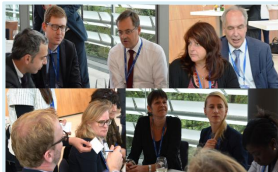
Directeurs de la Réunion Jeunesse Luxembourg – 09/2015

Septembre 2015, saisissant l'occasion d'être réuni au Luxembourg, les directeurs ministériels de la jeunesse engagés dans IVO4ALL, France Volontaires et la Commission européenne se sont rencontrés et ont convenu de joindre leurs efforts afin d'assurer un impact plus robuste des politiques visant un meilleur accès des jeunes aux services de mobilité internationale.